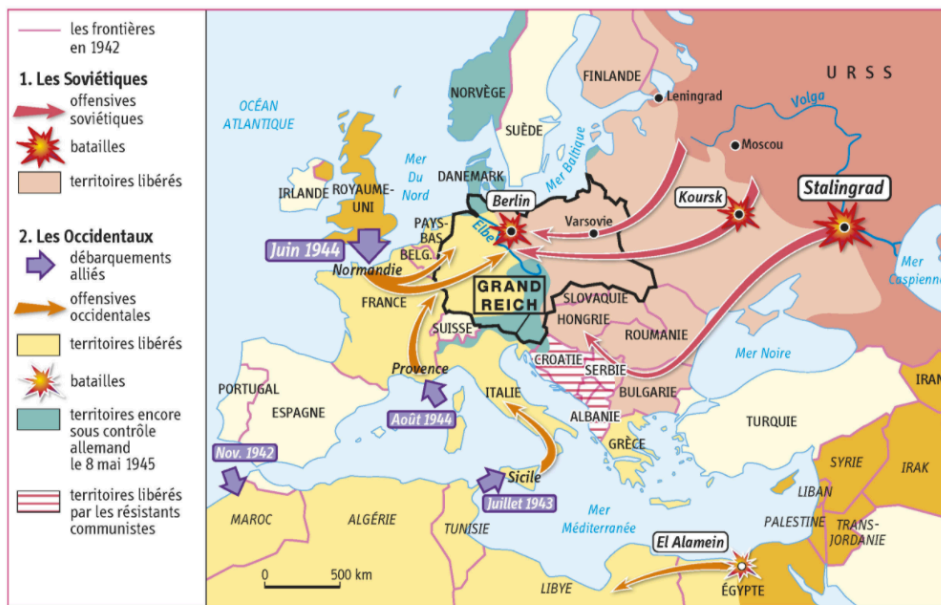
4 La libération de l'Europe par les Alliés (1943-1945)